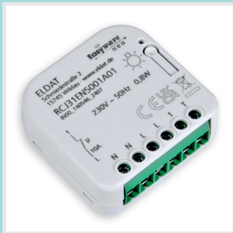
RCJ31, RCJ32, RCJ33, RCJ34