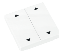
RTS23-ACC-02-xxP2 2x AUF/ZU