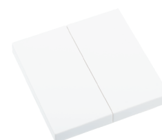
RTS23-ACC-01-xxP2 2x EIN/AUS