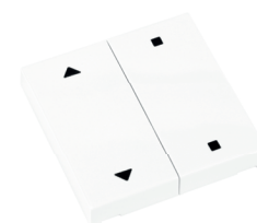
RTS23-ACC-03-xxP2 1x AUF/STOPP/ZU